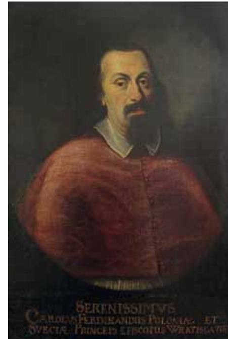
Plocko vyskupas Karolis Ferdinandas Vaza (1613–1655), Daniel Schultz (Danielis Šulcas), XVII a. vid.

Bishop of Plotsk Karol Ferdynand Vasa (1613–1655), Daniel Schultz, mid-17th c. MNy