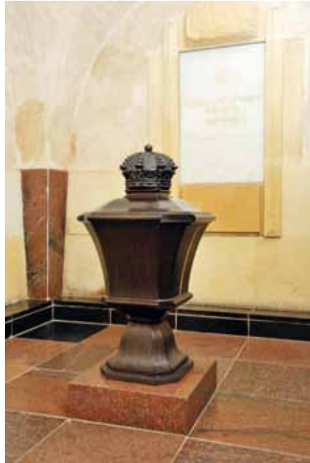
Urna su Vladislavo Vazos širdimi po Vilniaus katedros Šv. Kazimiero koplyčia Urn with Ladislaus Vasa's heart underneath the St Casimir's Chapel at Vilnius Cathedral

dėlto gedulingoji procesija labai greitai paliko Gardiną ir jau birželio 24 d. pasiekė Varšuvą. Tai rodo tam tikrą skubėjimą ir planų keitimą, nes – bent jau nuo gegužės 25 iki birželio 11 d. – Gardinas buvo nurodomas kaip valdovo šarvojimo vieta. Be to, tik liepos 16 d. Varšuvoje darbą pradėjo Konvokacinis seimas 79 .