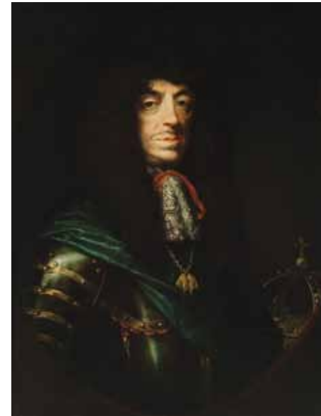
Lenkijos karalius ir Lietuvos didysis kunigaikštis Jonas Kazimieras Vaza (1609–1672), Danielis Šulcas (Daniel Schultz), apie 1660 King of Poland and Grand Duke of Lithuania John Casimir Vasa (1609–1672), Daniel Schultz, ca 1660