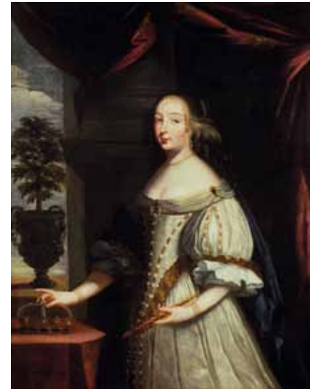
Antroji Vladislovo Vazos žmona Marija Liudvika Gonzaga de Nevers (1611–1667), Šarlis Bobrenas (Charles Beaubrun), 1668