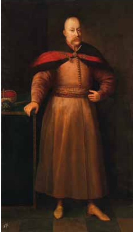
Lietuvos Didžiosios Kunigaikštystės lauko etmonas Jonušas Radvila (1612–1655), Danielis Šulcas (Daniel Schultz), 1652 Field Hetman of Grand Duchy of Lithuania Janusz Radziwiłł (1612–1655), Daniel Schultz, 1652