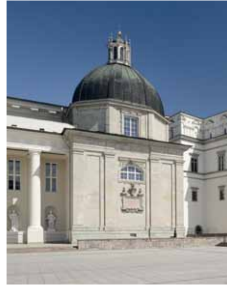
Vilniaus katedros Šv. Kazimiero koplyčia St Casimir's Chapel at Vilnius Cathedral

Stepono Batoro kūnas čia buvo pašarvotas ir laikytas tol, kol jau Lenkijos karaliumi išrinktas Žygimantas Vaza 1588 m. patvirtino Trečiąją Lietuvos Statutą, o atsakydami į tai Lietuvos didikai jį pripažino Lietuvos didžiuoju kunigaikščiu 74 . Todėl į vaidus tarp Lietuvos ir Lenkijos didikų dėl Vladislovo Vazos kūno reikia žiūrėti kaip į tęstinį Lietuvos Didžiosios Kunigaikštystės didikų tikslą savo šventovėje Vilniaus katedroje turėti velionių valdovų kūnus. Kita vertus, valdovo kūno sulaikymas galėjo atnešti ir politinių dividendų siekiant daugiau teisių Lietuvos savarankiškumui bendroje valstybėje su Lenkijos Karalyste.