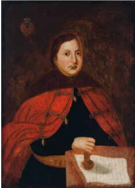
Lietuvos Didžiosios Kunigaikštystės pakancleris Kazimieras Leonas Sapiega (1609–1656), XVIII a.

Deputy Chancellor of the Grand Duchy of Lithuania Kazimierz Lew Sapieha (1609–1656), 18th c.