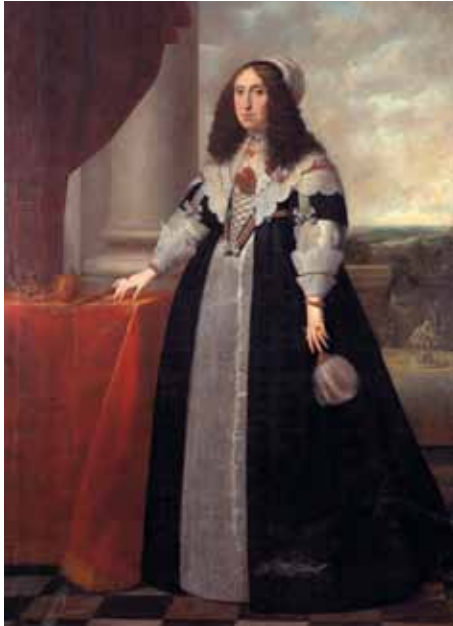
Pirmoji Vladislavo Vazos žmona Cecilija Renata Habsburgaitė (1611–1634), Petras Dankersas (Pieter Danckers de Rij), 1643

Ladislaus Vasa's first wife Cecilia Renata of Austria (1611–1634), Pieter Danckers de Rij, 1643 NM