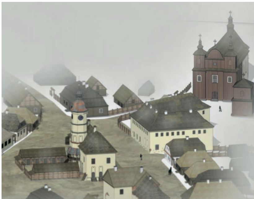
3 pav. Hipotetinis Merkinės centrinės aikštės vaizdas su miesto rotuše bei dominikonų konvento pastatais XVIII a. antroje pusėje

Fig. 3. Hypothetical view of Merkinė's central square with the town hall and the buildings of the Dominican convent in the second half of the 18 th century.