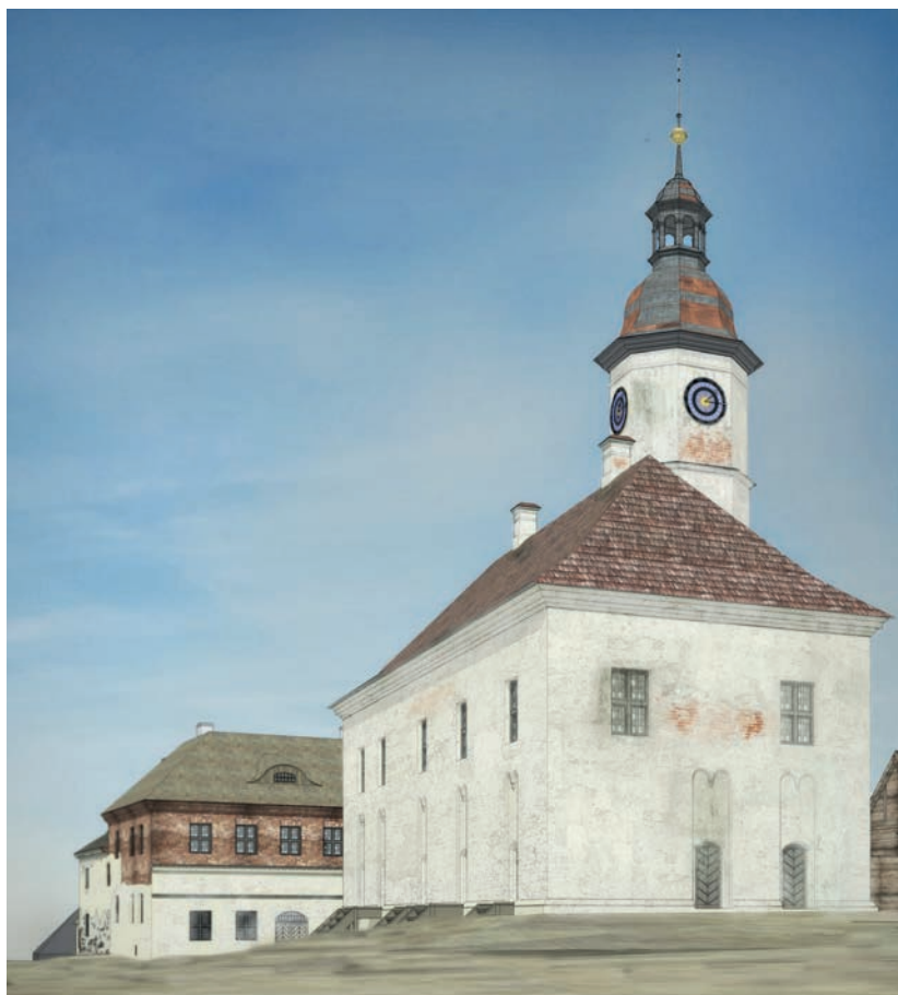
4 pav. Vazos namo ir miesto rotušės XVIII a. antros pusės vaizdinio rekonstrukcija

Fig. 4. Visual reconstruction of the Vasa House and town hall in the second half of the 18 th century.