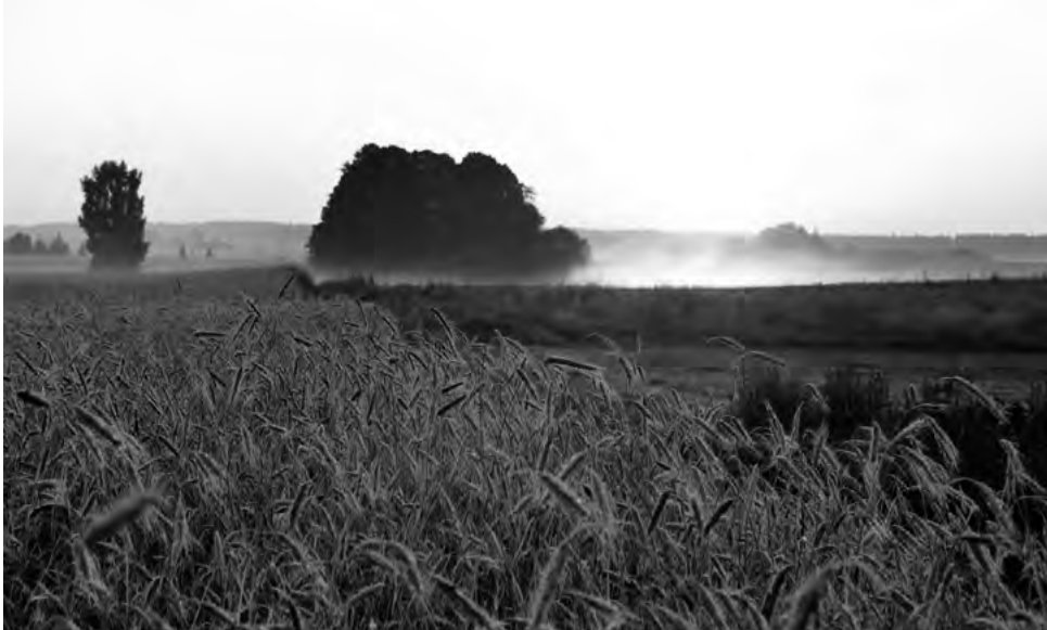
o Žeimių laukai, 2005 m.